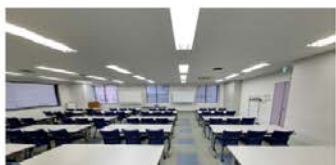
3L 大会議室(125㎡) ■3名掛:72名 ■2名掛:48名