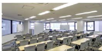
5階 L 会議室(125㎡) ■3名掛:72名 ■2名掛:48名