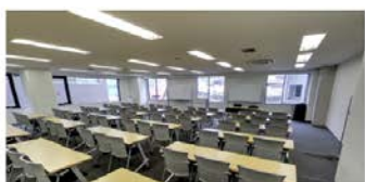
5階 LL 会議室(155㎡) ■3名掛:108名 ■2名掛:72名